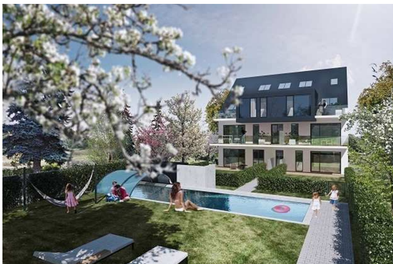
Je libo byt se soukromým bazénem a zahradou?

Toto jsou komerční sdělení. iDNES.cz neovlivňuje jejich obsah a není jejich autorem. Více